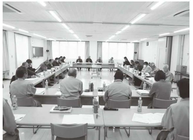
第18回運営委員会(平成31年1月26日)

土地改良法が改正され、特に准組合員制度が導入可能となったことについて、当区では従来より所有者、耕作者が賦課金を分担して納付いただいていた現状から、准組合員制度の導入を検討しています。このことについて、各委員からそれぞれの立場で貴重なご意見を伺いました。