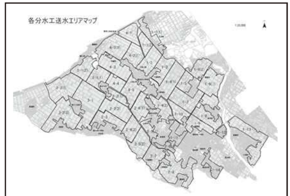
各分水工送水エリアマップ(運転計画表裏面)

運転計画表の裏面に各分水工送水エリアマップを付けておりますので、ご活用ください。