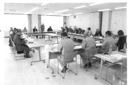
第20回運営委員会(令和2年1月25日)

土地改良法が改正され、准組合員制度を導入することについて、令和元年12月中旬から集落説明会を実施している状況を報告し、組合員の方々からの意見や課題に関して、各委員からそれぞれの立場で貴重なご意見を伺いました。それらのご意見を参考に適正な運営を行ってまいります。