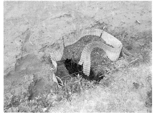
小さな漏水が大きな漏水に

※送水計画変更は送水情報メールにてお知らせいたしますので、必ずご登録をお願いします。